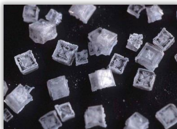
Cristaux de sel

Les cristaux de sel ont une structure cubique (ce que tu as observé au fond du bocal) et peuvent s'accoler par milliers pour former une grappe ayant une allure de chou-fleur (ce que tu as obtenu le long de la ficelle et du crayon).