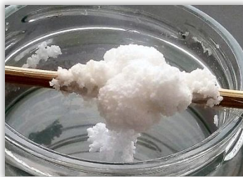
Agglomérat en chou-fleur

La cristallisation se produit lorsqu'un liquide s'évapore ou se refroidit lentement , ce qui augmente la concentration des éléments dissous ou réduit leur capacité à rester dissous, puis provoque leur solidification. Tout mouvement du liquide perturbe la formation des cristaux (voilà pourquoi tu dois éviter d'heurter ton bocal).