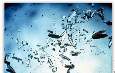
... sur Terre

À bientôt pour de nouvelles découvertes et sur le