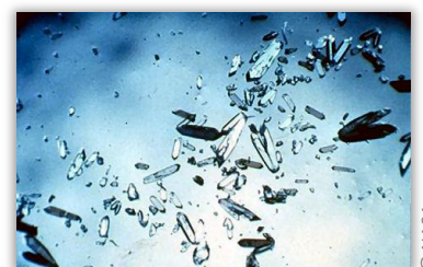
... sur Terre

À bientôt pour de nouvelles découvertes et sur le